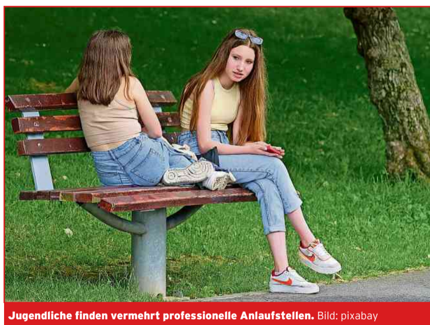
Jugendliche finden vermehrt professionelle Anlaufstellen.

Die offene Jugendarbeit (Plattform Glattal, Verein für Soziale Angebote) organisiert Freizeitaktivitäten für Kinder und Jugendliche ab der 4. Klasse bis zur Sekundarschule und stellt im Gemeinschaftszentrum 90i in Rümlang einen Raum zur Verfügung, wo sich